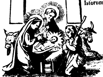
Fundamentum Humilitatis et prototypu

Memineris, lector, hosce gradus humilitatis proprie et potissimum ad monachos et religiosos pertinere, quibus etiam S. Benedictus eos commendat et proponit ascendendos, ut ad colmen charitatis, in qua perfectio religionis consistit, perveniant.